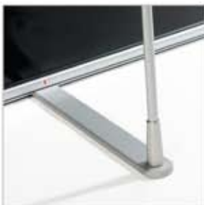
PIED ET MAT. Aluminium