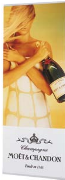
Banner Stand format 60 x 140 cm