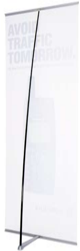
Banner Stand - vue de dos

Le Banner Stand a été spécialement conçu pour les sociétés changeant souvent leur message de communication et désireuses d'acquiescer un système modulable. Grâce à son montage rapide et à son faible encombrement, le Banner Stand permet de créer facilement et rapidement un environnement dynamique pour l'animation de réunions internes ou externes quel qu'en soit le lieu. Avec son design très simple et épuré, il offre à votre message une mise en valeur discrète et efficace. Conditionné dans un sac de transport matelassé.