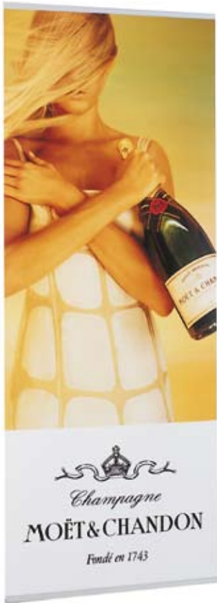
Banner Stand format 80 x 200 cm