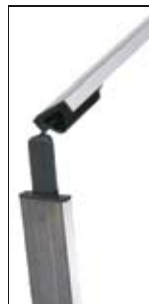
Barres magnétiques articulées