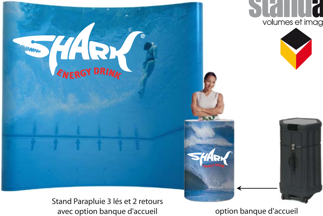
Stand Parapluie 3 lés et 2 retours avec option banque d'accueil