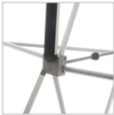
BARRE MAGNETIQUE. Aimantation