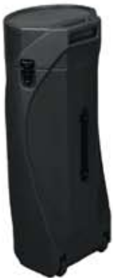
CONTAINER. PVC renforcé sur roulettes