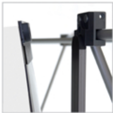
SUSPENTE HAUTE. Aimantation