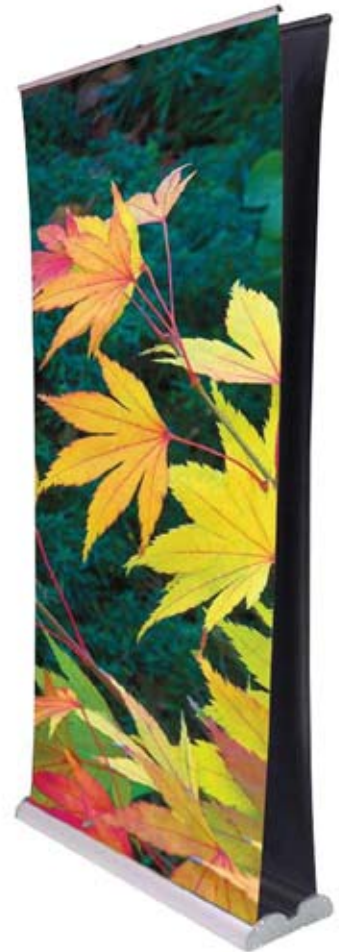
Orient recto/verso largeur 100 cm

L'Orient recto/verso est une structure à enrouleur avec l'un des meilleurs rapports qualité/prix du marché. Stable et facile à monter, il vous permet d'exposer sur deux faces votre communication, en utilisant des messages similaires, complémentaires ou différents. Les visuels venant se fixer sur le même mât, la tension exercée par les enrouleurs ne fait que renforcer la stabilité et la verticalité de la structure. Le carter et le mât sont en aluminium brossé. Conditionné dans un sac de transport nylon noir.