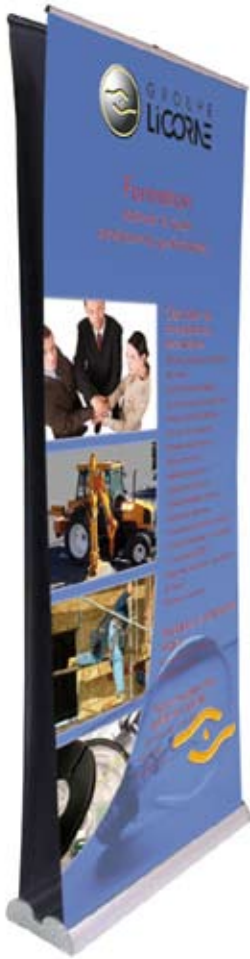
Orient recto/verso largeur 80 cm